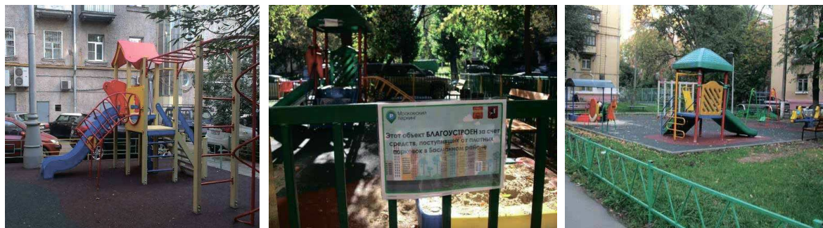
слева направо: М. Сухаревская пл., д. 1 Токматов переулок, д. 3-5 Госпитальный Вал, д. 5, к. 16