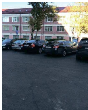
слева направо: Трубников переулок, д. 11-13, с. 1 Староваганьковский переулок, д. 15 Марксисткая улица, д. 5