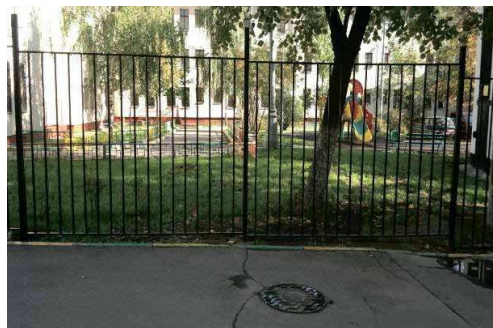
слева направо: Русаковская улица, д. 7 Шелепихинское ш. вл. 11, к. 3