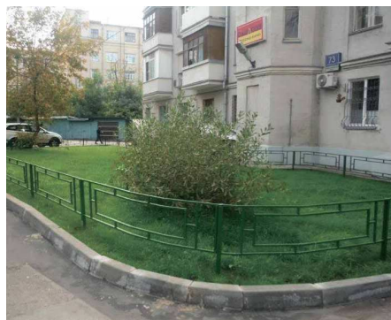
слева направо: Новослободская улица, д. 73 2-й Щемилловский пер., д. 16/20