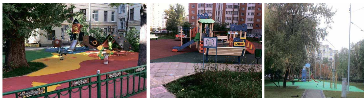
слева направо: Вишняковский пер., д. 23 Ковров пер., д. 4, к. 1 1-й Вражский пер., д. 4