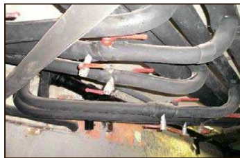
слева направо: Шелепихинское ш., д. 17, к. 1 Брошевский пер., д. 8 Ул. Павла Андреева, д. 28, к. 7