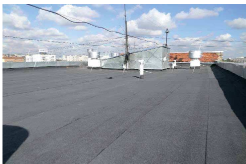
слева направо: Новокузнецкая ул., д. 43/16 Трифоновская ул., д. 57, к. 1